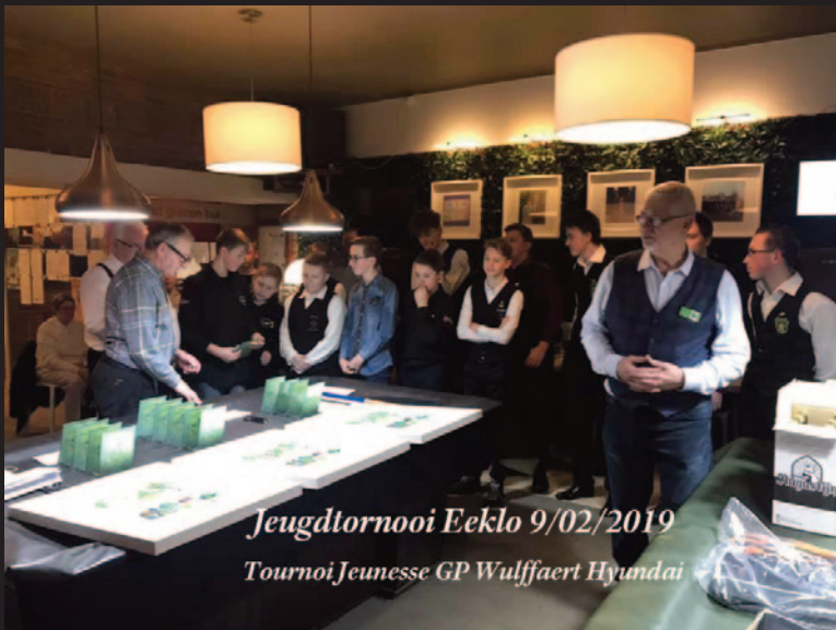
Jeugdturnooi Eeklo 9/02/2019 Tournoi Jeunesse GP Wulffaert Hyundai