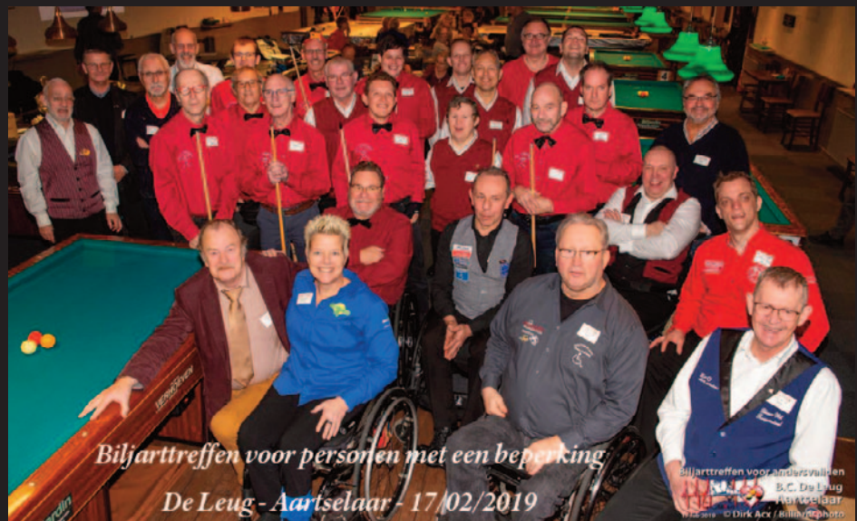
Biljarttreffen voor personen met een beperking De Leug - Aartselaar - 17/02/2019